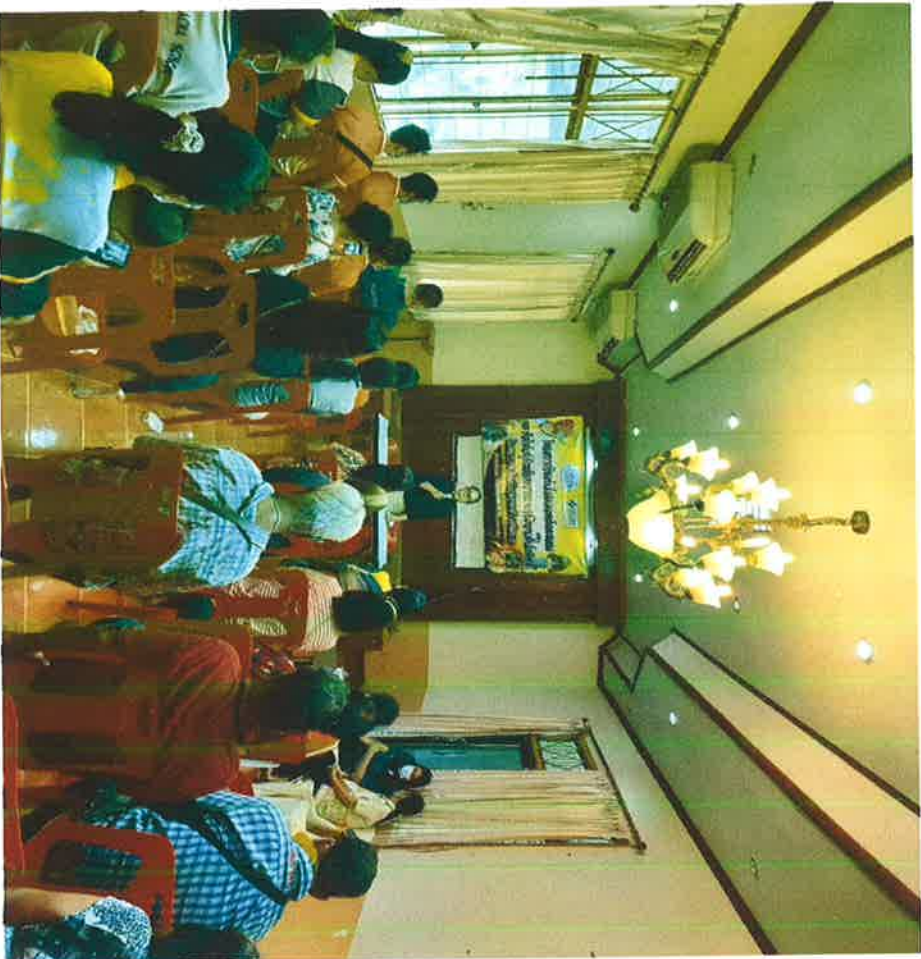
ภาพกิจกรรมโครงการป้องกันหลอดเลือดสมองและหัวใจผู้ป่วยเบาหวานและความดันโลหิตสูง