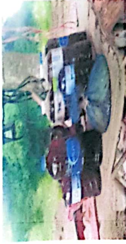
โดยคุณอ็อบแอ็บ